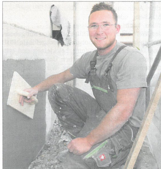
Maurer Robert Gradl von Duswald Bau in Lamprechtshausen freut sich auf das Abenteuer Berufs-WM.